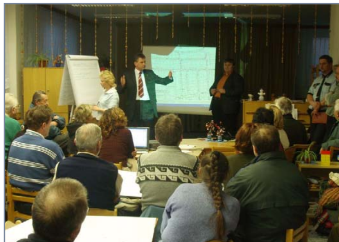
Fotografie zachycuje atmosféru z plánovacího setkání s občany, které bylo zaměřeno na problematiku dopravy a parkování v ulicích Slovenská a Slezská v Chrudimi.

Zvyšování kvality veřejné správy na místní úrovni je často vnímána v úzkém pojetí jako zavádění metod kvality do úřadu města či obce za účelem zvýšení jeho efektivnosti. Kvalitu práce radnice však určuje i její schopnost komunikace s veřejností a vytvoření prostoru pro aktivní spolupráci na rozvoji města, ať již ve formě diskuse či zapojení do konkrétních aktivit a projektů.