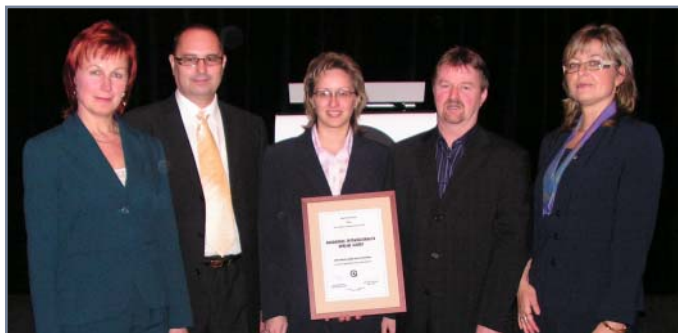
Prostějov byl jedním z oceněných Zdravých měst na letošní Národní konferenci kvality ve veřejné správě v Karlových Varech za svůj postup v rámci MA21.

Další velkou kapitolou zvyšování kvality veřejné správy je zapojení mladé generace. Dětské a studentské parlamenty a zastupitelstva jsou nedílnou součástí Zdravých měst. Jedním z posledních úspěchů se může pochlubit také Zdravá městská část Praha – Libuš a Písnice . Projekt „Bezpečná cesta do školy“ totiž s pomocí úřadu realizovalo místní žákovské zastupitelstvo a vysloužilo si za svoji práci obdiv a uznání nejen představitelů městské části, se kterými o řadě problémů v dopravě diskutovalo, ale rovněž svých vrstevníků a dalších kolegů na celopražském semináři k této problematice. Komunikace v Libuši a Písnici probíhá i pomocí multimediální služby MMS. Pokud vidíte rozbité lavičky či nepořádek na ulici, můžete využít svůj mobil či digitální fotoaparát a poslat fotku na úřad MČ. Zde se problému ujme konkrétní osoba, fotku zveřejní na webu a doplní komentář o tom, kdy a jak bude problém vyřešen.