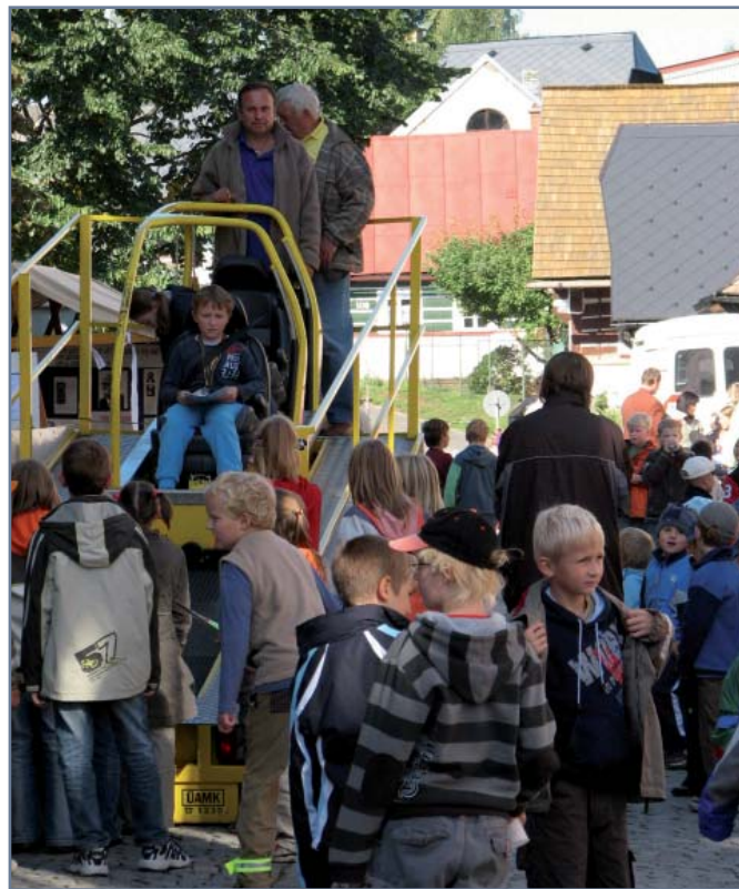
Oblíbenou, ale také poučnou atrakcí kampaně ETM a DBA je tzv. simulátor nárazu. Dokáže věrně napodobit situaci, kdy dojde k čelnímu nárazu vozidla a cestující je vymrštěn dopředu ohromnou silou, kterou si často ani nedokážeme představit. Proto je důležité se ve vozidle poutat i při malých rychlostech.

tem. Pozornost byla věnována zejména dodržování povolené rychlosti, přechodům pro chodce, vybavení kol a požití alkoholu. V pátek 21. září proběhla ve Zdravém městě Uherský Brod akce s názvem „Citron nebo jablko“, při níž děti kontrolovaly dodržování povolené rychlosti a řidičům rozdávaly jako odměnu v případě dodržení rychlosti jablko a v případě překročení citron. Společné hlídky dětí ze tří základních škol a Policie ČR střežily dodržování předpisů během Evropského týdne mobility také ve Zdravém městě Varnsdorf , a to pod heslem „Kdo dostane sladké jablíčko a kdo kyselý citron?“.