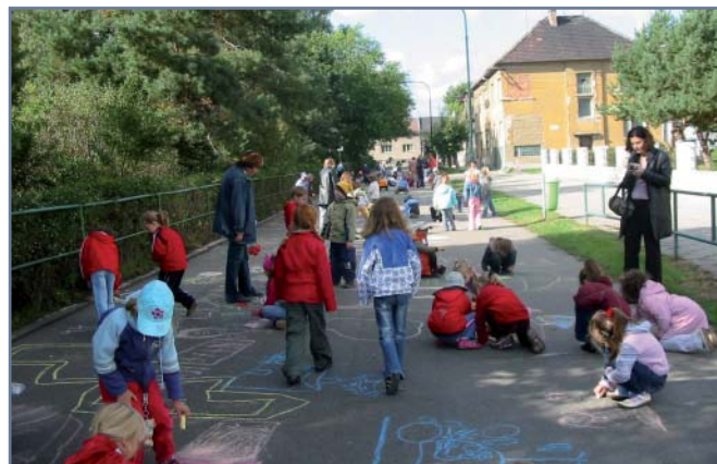
Ulice lidem v Hodoníně opravdu patří. I když plné aut, motorek a jiných dopravních prostředků, tentokrát dopravní zácpa ani nehoda nehrozily.

Poprvé v historii Evropského týdne mobility oficiálně podpořil tuto kampaň také Zdravý kraj Vysočina . Spolupráce na regionální úrovni a společná propagace umožňuje zapojeným městům a obcím oslovit velké množství obyvatel, což je hlavním cílem ETM a DBA.