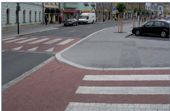
Fotografie jedné z částí vítězného projektu Zdravého města Šternberk „Regenerace a revitalizace centra města“, za nějž obdrželo město také finanční prémii 80 tisíc Kč. Druhé místo obsadilo Zdravé město Hodonín, třetí Zdravé město Strakonice a do první desítky se probojovalo také Zdravé město Poděbrady.

Přehled dalších aktuálních i proběhnuvších akcí najdete na rozcestníku www.udrzitelna-doprava.cz .