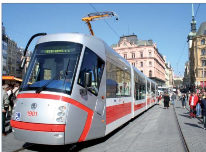
Od 20. září se bude moci každý obyvatel i návštěvník moravské metropole svěřit Porsche. Alespoň pokud využije MHD a zcela novou nízkopodlažní tramvaj Škoda 13T v designu Porsche, která byla slavnostně pokřtěna právě v den oslav DBA.

K omezení počtu automobilů ve Zdravém městě Mladá Boleslav během Evropského dne bez aut 22. září přispívala celotýdenní distribuce letáků v autobusech, které vyzývaly obyvatele, aby nechali své auto doma a využili možnosti bezplatného cestování prostředky hromadné dopravy. Zdravé město Vsetín uspořádalo dne 19. září veřejnou diskusi představitelů Městského úřadu se zástupci dopravců zajišťujících veřejnou dopravu na Vsetínsku. Diskuze potvrdila přínosy spolupráce obcí při koordinaci vlakové a autobusové dopravy v regionu. Pod heslem „Cestujte bezpečně a bez starostí“ proběhla v rámci Dne bez aut ve Zdravém městě Brno na náměstí Svobody propagační akce, na níž byl představen nový nízkopodlažní kloubový autobus a také nová nízkopodlažní tramvaj. Návštěvníci rovněž získali praktické informace o integrovaném dopravním systému Jihomoravského kraje. Zdravé město Jihlava připravilo pro své občany Den otevřených dveří v Dopravním podniku města Jihlavy. Součástí akce byly rovněž jízdy historickým autobusem a vystavení dvou autobusů na Masarykově náměstí. V prostorách radnice proběhla výstava o historii jihlavské městské hromadné dopravy s názvem „Co všechno odvezl čas“. Historii dopravy obecně se věnovala výstava, která proběhla u příležitosti Evropského týdne mobility ve Zdravém městě Uherské Hradiště . Výstavu s názvem „Člověk a doprava“ v Redutě doplnila také beseda na téma historie a současnost vlivu dopravy na životní prostředí.