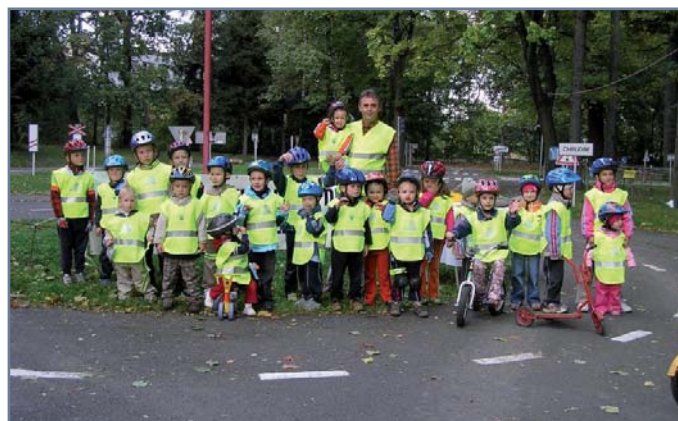
Vyvrcholení kampaně „Na kolo jen s přilbou“ přineslo zajímavé statistiky. Na základě zjištění Městské policie Chrudim mělo přilbu 79 % kontrolovaných cyklistů do 18 let. V kombinaci s reflexními vestami zvyšuje přilba mnohonásobně bezpečnost cyklistů i bruslařů.

Ještě před oficiálním začátkem ETM byla 13. září slavnostně otevřena nová naučná stezka ve Zdravém městě Karlovy Vary , která přispěje k zatraktivnění stávající cyklotrasy Stará Role – Nová Role. Jak uspořit palivo a snížit škodlivé emise v dopravě si mohli místní řidiči navštívit 20. září na Poštovním mostě a přilehlých vytyčených trasách v rámci kurzů úsporné jízdy. Akci s názvem „Hledáme řidiče třídy A“ uspořádalo rovněž Zdravé město Chrudim . Řidiči si mohli na pětakilometrové trase za pomoci zkušených instruktorů bezplatně otestovat své schopnosti a osvojit si užitečné návyky pro úspornou jízdu. V informačním stanu mohli návštěvníci akce současně získat doprovodné informační materiály a poradit se s přítomnými odborníky. Progresivní inovace v dopravě byla k vidění v pátek 21. září ve Zdravém městě Desná , kde proběhla prezentace veřejné nabíjecí stanice pro elektromobily. Zdravé město Strakonice pověřilo své dětské zastupitele sčítáním aut na frekventovaných křižovatkách a příjezdových komunikacích. Ve většině případů byl zjištěn nárůst dopravy oproti předchozím statistikám. S možností, jak dlouhodobě snížit počet automobilů nejen v ulicích Strakonice, se měli možnost seznámit účastníci besedy, která proběhla již 12. září ve Šmidingerově knihovně a pojednávala o problematice sdílení automobilů, známé též jako car-sharing.