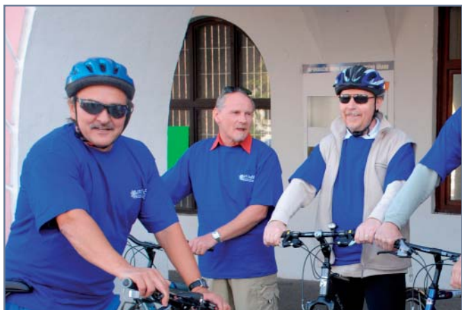
Premiérové zapojení do Evropského týdne mobility náležitě oslavili také lito- měřičtí zastupitelé. Na cestu na zasedání zastupitelstva se tentokrát vydali na kolech.