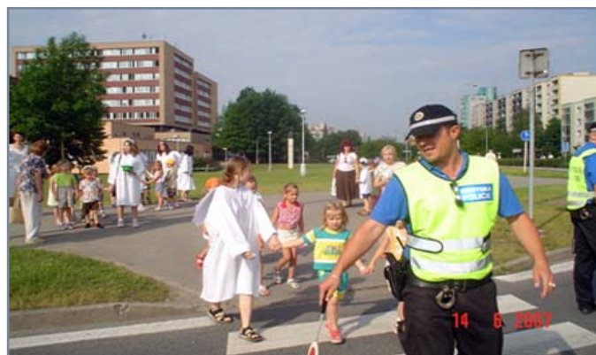
Kampaně v Orlové provázeli „andělé“, kteří ve spolupráci se strážníky městské policie pomáhali dětem správně přecházet silnici.