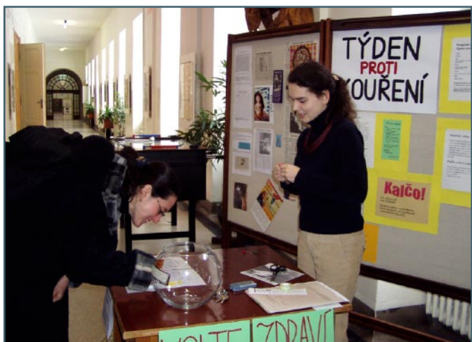
„Týden proti kouření“ byl součástí kampaně Den bez tabáku v kroměřížském Arcibiskupském gymnáziu.