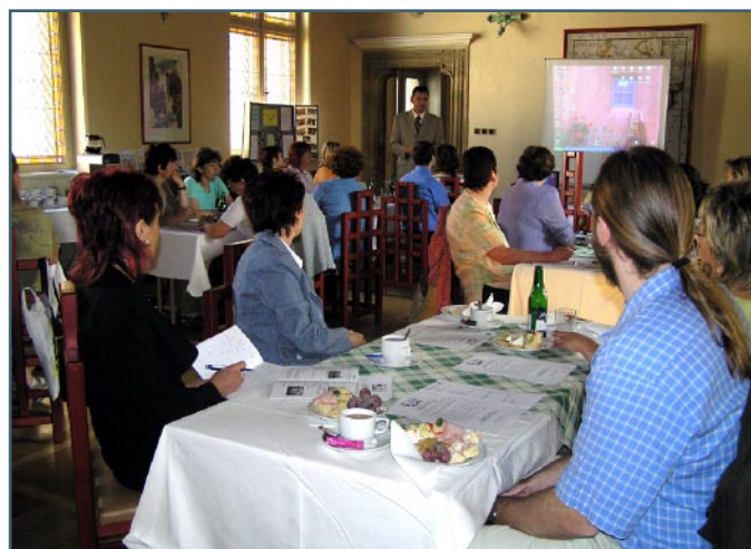
Letošní pátou Sekci NSZM hostila opět Chrudim.

Sekce NSZM se letos již podruhé konala v Chrudimi a její účastníci měli možnost shlédnout prezentace na téma „Normální je nekouřit – výchova k nekuřáctví nejen na školách“.