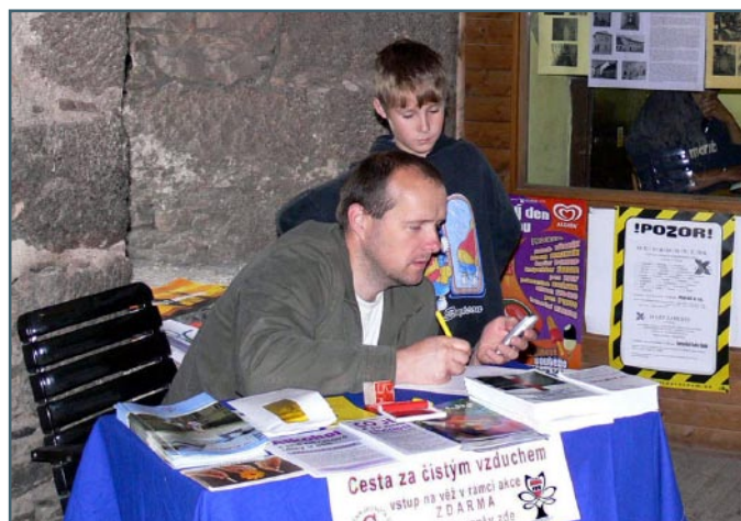
V rámci kampaně Den bez tabáku byl výstup na městskou věž v Třebíči zdarma.

Mezinárodní kampaň s názvem Přestaň a vyhraj 2006 si klade za cíl snížení celosvětového počtu kuřáků. Prvního ročníku soutěže se v roce 1994 účastnilo 13 zemí, v roce 2002 však již 80 zemí a letos se očekává účast 100 států ze všech kontinentů s více než 1 milionem soutěžících. Účinnost a efektivita této kampaně ve vztahu k nákladům