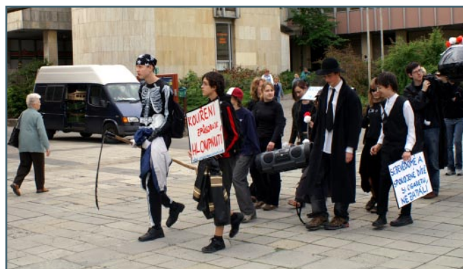
Manifestní pochod městem proti kouření se odehrál ve Vsetíně.

I z těchto důvodů se Zdravá města, obce a regiony každoročně zapojují do kampaně „Den bez tabáku“ a dalších programů prevence kouření a připravují celou řadu zajímavých akcí. Mají za cíl především zvýšit povědomí zejména u dětí a mládeže, ale i jejich rodičů, o negativních účincích kouření ve všech jeho podobách. Nejen o kampani se dočtete v tomto vydání Zpravodaje NSZM.