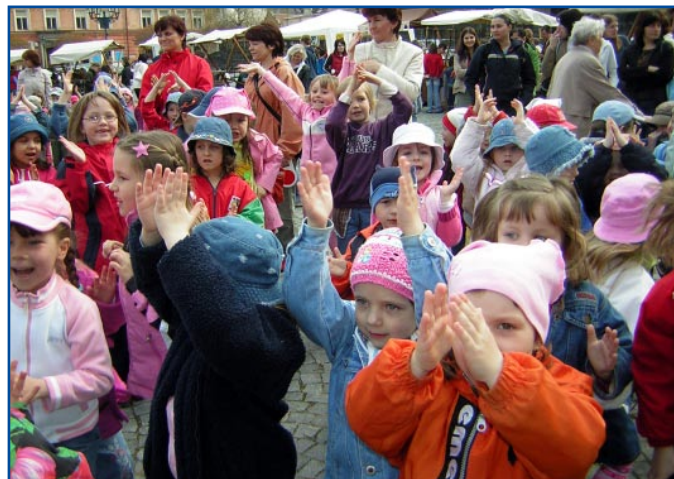
Svátek Země byl zážitkem především pro ty nejmenší.

Den Země postihuje velmi širokou problematiku, a proto je široké i spektrum akcí, které jej provázejí. Během kampaně se konalo nepřeborné množství výstav, filmových projekcí, osvětových akcí a také soutěží s ekologickou tematikou pro děti. Ve Zdravém městě Orlová proběhly přírodovědné soutěže na základních školách i na gymnáziu. V rámci Dne Země se ve Zdravém městě Kuřim kromě řady jiných akcí konal např. program „maňásková ekologie“ pro děti či tzv. ekokvíz, který připravil dětský parlament. Ve Veselí nad Moravou byla vyhlášena literárně výtvarná soutěž s názvem „Já su sedlák“ a všechny přihlášené práce byly vystaveny ve foyer místního kina Morava. V Mladé Boleslavi připravili soutěžní miniprojekt pro základní školy a nižší gymnázia s názvem Klenice – čistá řeka . Cílem projektu, který obsahoval část teoretickou, část praktickou a část kreativní, bylo vzbudit v dětech zájem o jejich okolní životní prostředí. V Kopřivnici pořádali u příležitosti Dne Země meziškolní soutěž – Debatní ligu , jejímž tématem bylo tentokrát „Životní prostředí Kopřivnice, jeho ochrana v praxi“. Cílem soutěže bylo ověření a prohloubení znalosti mladých lidí o jejich místním životním prostředí a možnostech jeho ochrany. Jedním z cílů bylo rovněž probudit myšlenku komunikace mezi radnicí a mladou generací. Výtvarné soutěže s ekologickou