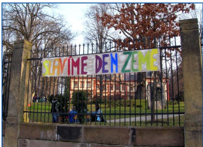
Tímto nápisem vítali návštěvníky na oslavách Dne Země ve Zdravém městě Jilemnice.

Kompletní přehled aktivit k této kampani najdete na: http://www.nszm.cz/dze