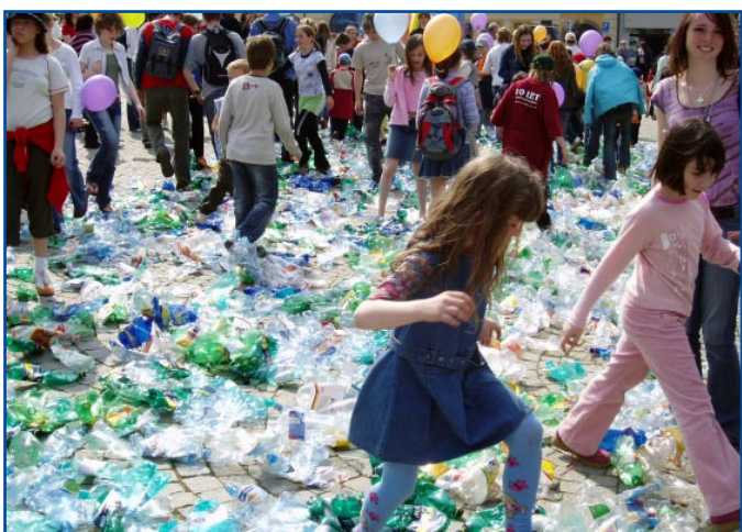
Na Karlově náměstí v centru Třebíče byl ustaven nový český rekord – účastníci vytvořili koberec čítající 2300 PET lahví, který byl posléze rozšlapán a odvezen k ekologické likvidaci.

Ve Zdravém městě Třebíč proběhlo formou soutěže třídění víček z PET lahví a přímo na Karlově náměstí byl vytvořen první český rekord - koberec z PET lahví, který čítal 2300 kusů a který byl zaznamenán zástupcem pelhřimovské agentury Dobrý den jako oficiální. Také ve Zdravém městě Karviná probíhá projekt s názvem Plasty – sběr víček z PET lahví , který propaguje recyklaci kvalitního plastu. Po dosažení určitého množství jsou víčka svázena k dalšímu zpracování, jehož výsledkem jsou nové výrobky – např. zatravnovací dlaždice.