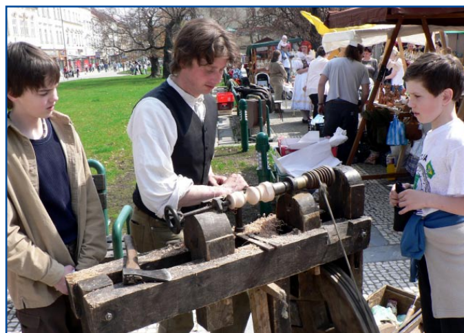
Ekojarmarky patří neodmyslitelně ke svátku Země. Jejich součástí je tradičně i ukázka starých řemesel, stejně jako v Prostějově.

Tradiční součástí oslav Dne Země jsou nejrůznější výstavy a prezentace produktů ekologického zemědělství a tradičních rukodělných výrobků. Ekojarmark se konal ve Zdravém městě Veselí nad Moravou , kde mohli návštěvníci ochutnat např. biopotraviny jako kváskový chléb či biovíno. Rovněž měli možnost zakoupit informační materiály a publikace o regionu Bílých Karpat a děti si mohly vyzkoušet své znalosti při luštění tajenky na téma ekozemědělství. Ve Zdravém městě Hodonín pořádali Miniekojarmark, na kterém prodávaly děti ze škol a zájmových organizací výrobky z přírodních materiálů. Jarmark zdravého životního stylu a ekofirem se konal také ve Zdravém městě Uherské Hradiště a kromě prodeje zdravé výživy a bylin zde zástupci Střední průmyslové školy Otrokovice prováděli zjišťování kvality vody z přinesených vzorků. Ekojarmark proběhl i na Masarykově náměstí ve Zdravém městě Třeboň . Ekologicky šetrné zemědělství mělo na Den Země své zastoupení také v Prostějově . Vedle velkého množství tradičních řemesel byly k vidění také výrobky se značkou Fair Trade (FT je alternativní přístup ke konvenčnímu mezinárodnímu obchodu a klade důraz na sociální a ekologický rozměr výroby a obchodu). Účastníci oslav Dne Země ve Zdravém městě Slaný měli možnost poznat ekologické zemědělství přímo na ekofarmě. V Městských