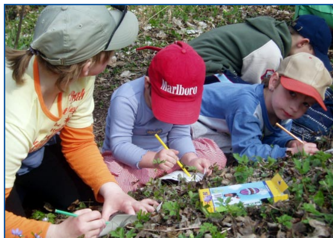
Pobyt v přírodě je pro děti stejně důležitý jako její poznávání. Dne Země se v Litoměřicích zúčastnilo přes 400 dětí.

Součástí programu v rámci oslav Dne Země ve Zdravých městech byly často výlety do okolí a také návštěvy míst, kde lze poznávat rostliny a pozorovat živočichy. V Litoměřicích pořádali Procházku po Zemi , během níž děti u Pokratického rybníka plnily úkoly spojené s poznáváním přírody. Pro nejmenší byl připraven program s názvem Pojďte s námi za zvířátky – Den Země pro mateřské školy , kterého se zúčastnily přes čtyři stovky dětí. Během celého dubna probíhal na základní škole Zdravém městě Boskovice Měsíc lesů , při kterém žáci v rámci projektového vyučování podnikli několik poznávacích procházek lesem. Exkurze do přírody byly také součástí bohatého programu v Brně . Do nejstaršího veřejného parku v Čechách a na Moravě „Lužánky“ mohli návštěvníci podniknout netradiční procházku, doplněnou tentokrát také odborným výkladem. Záchraná stanice volně žijících zvířat ve Zdravém městě Telč pořádala Den otevřených dveří, a také se podílela na akci Poznávání ptačího zpěvu