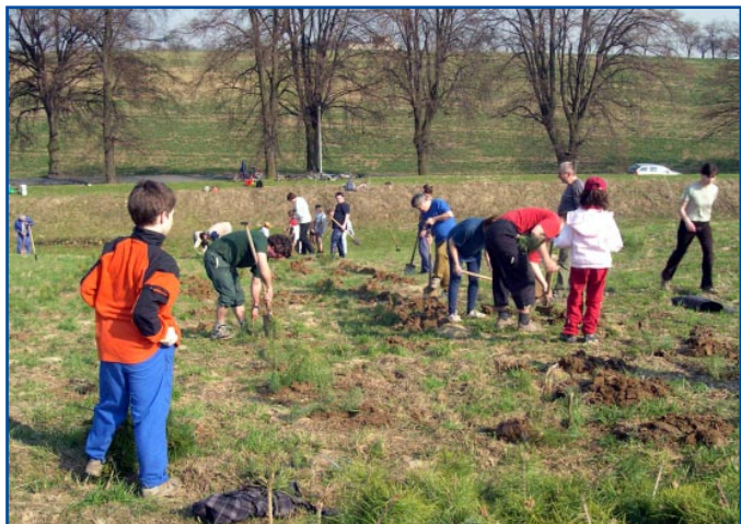
V rámci Dne Země zasadili ve Zdravé obci Bolatice na 5000 nových sazenic stromů.

z Afghánistánu, které přibližují život v jedné z nejchudších zemí světa. Autorem snímků tvořících výstavu s názvem „Camp Afghanistan“ je David Šifra z organizace Vara, která se aktivně zapojuje do boje s chudobou. Žáci devátých tříd základních škol ve Zdravém městě Kroměříž zpracovávali projekt s názvem „Globální problémy současnosti“. Věnovali se závažným otázkám současného světa, hledali informace v encyklopediích, literatuře, na internetu a zpracovávali témata, jako je např. boj proti terorismu, úroveň vzdělání, sociální nerovnost, životní prostředí apod.