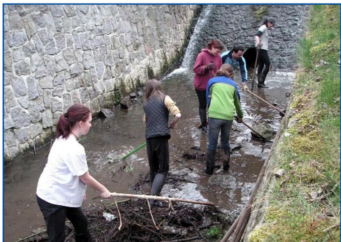
Mezi tradiční akce na Den Země patří také jarní úklid. Řada Zdravých měst a obcí jej uspořádala pod heslem Clean Up the World! neboli Uklidme svět!

Obyvatelé Zdravých měst se během Dne Země věnovali také zcela konkrétním činnostem souvisejícím s praktickou ochranou přírody. Ve Zdravém městě Mladá Boleslav realizují projekt s názvem Lípy pro zdraví , v jehož rámci zde děti z mateřské školy Sluníčko vysadily šest nových stromů. Vysaď svůj strom – pod tímto názvem proběhla akce ve Zdravém městě Boskovice , během níž byl vysazen na zahradě mateřské školy Na dolech symbolický strom života. V zámeckém parku ve Zdravém městě Jilemnice při příležitosti oslav Dne Země zasadili místní občané jilm, jenž je symbolem města a součástí městského erbů. O tom, že se i zde svátek Země vydařil, svědčí počet návštěvníků – letos 450. Staré tradice podpořili ve Zdravém městě Moravská Třebová , kde děti z přírodovědného kroužku II. ZŠ, ve spolupráci s Českým svazem ochránců přírody a žáky Speciální školy, vysadily olše podél místního potoka. Již nyní mysleli na největší svátky roku zástupci Zdravého města Brno . Zorganizovali sázení vánočních