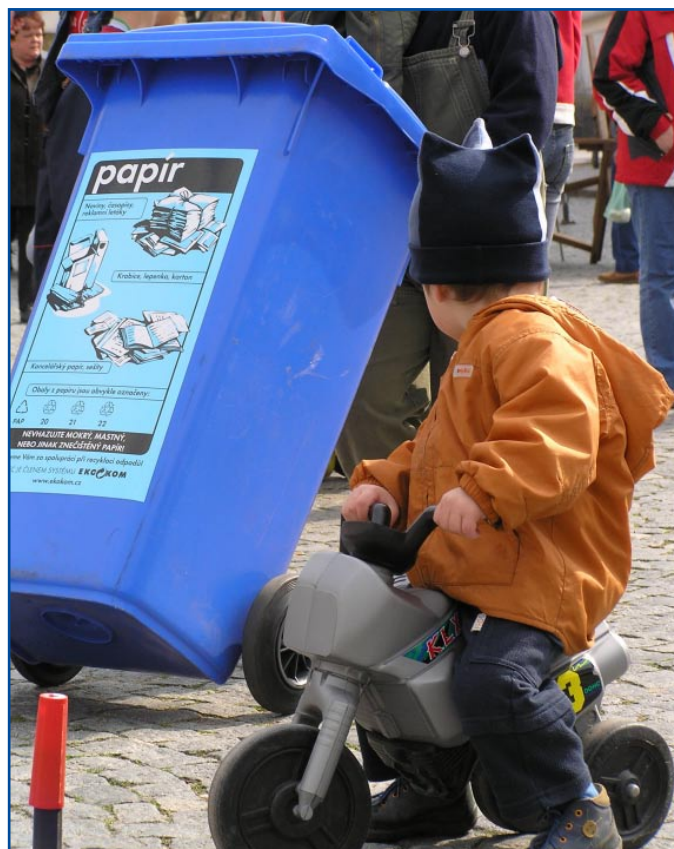
Už i tento malý účastník oslav ví, že až mu jednou jeho plastová čtyřkolka doslouží, do této popelnice určitě nepřijde.