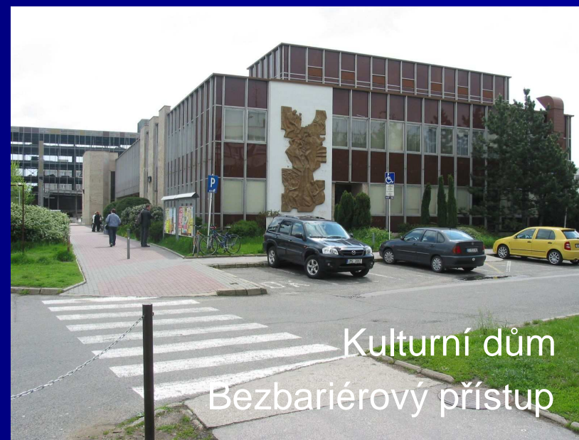
Kulturní dům Bezbariérový přístup